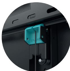
Système breveté de verrouillage automatique