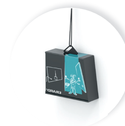
Cale de maintenance