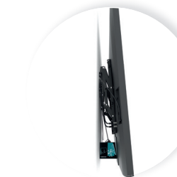
Position de maintenance