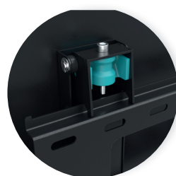
Système micrométrique du réglage de l'horizontalité