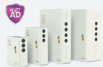
Coffret métal de 12 à 48V DC et de 2,5 à 20A